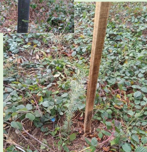
PLANTATION ET PROTECTION DE DOUGLAS