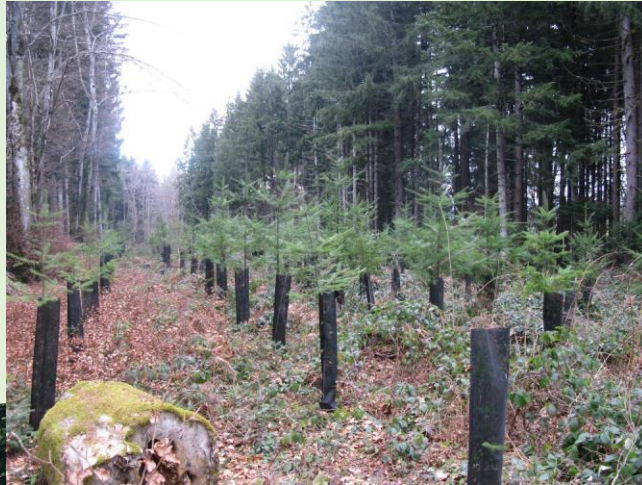
DEBROUSSAILLAGE DE PARCELLES FORESTIERES