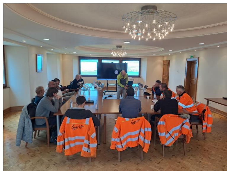
Journées Blanches organisées par l'APIEME, le CEREMA et le CERD à Saint-Paul-en-Chablais en 2025

Les 18 et 19 novembre 2025, les journées blanches ont été organisées par l'APIEME, le CEREMA 1 et le CERD 2 de Maxilly sur la commune de Saint-Paul-en-Chablais.