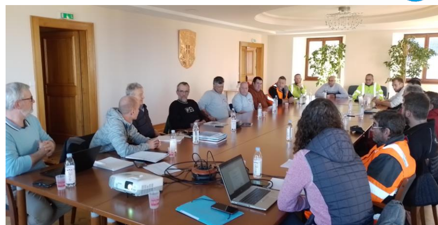
Journées blanches organisées par l'APIEME et le CEREMA à Lugrin et Saint-Paul-en-Chablais pour échanger avec les élus ainsi que les agents des services techniques des communes.

En 2021, l'APIEME missionne le CEREMA* afin de réaliser un diagnostic des pratiques de gestion hivernale sur les communes du territoire . Ce diagnostic a permis de définir un plan d'actions simplifié avec des préconisations techniques, des actions de formation et de communication. Le programme d'actions se décline au travers d'un plan d'actions global, composé de 33 actions, et de fiches actions spécifiques à chaque commune.